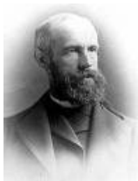
Granville Stanley Hall

L'américain Granville Stanley Hall fut le créateur du premier laboratoire de psychologie de l'Université John Hopkins aux Etats-Unis en 1883. Promoteur de la psychologie fonctionnelle américaine, il fut le fondateur du The American Journal of Psychology en 1887 38 .